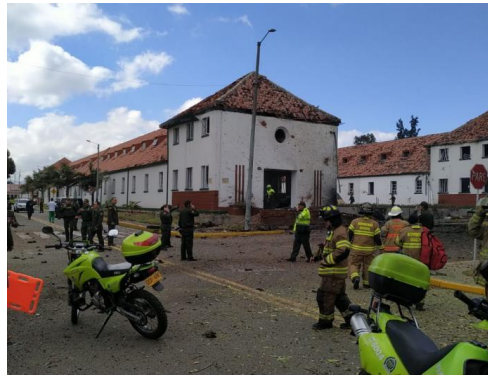
Escuela General Santander.

La noticia que realices debe responder a las cuatro preguntas básicas que está tiene: ¿Qué sucedió?, ¿cómo sucedió?, ¿Cuándo sucedió? ¿Dónde sucedió? Además debes seguir la siguiente estructura: título de la noticia, párrafo de entrada y cuerpo de la información.